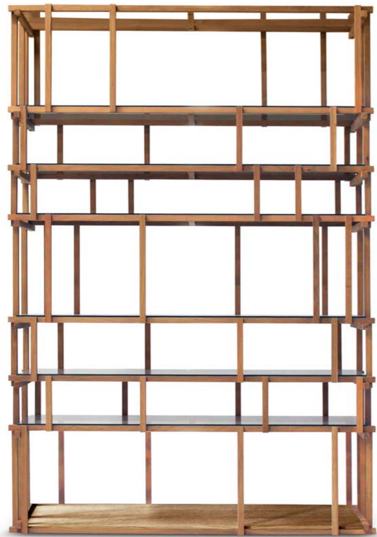
— Libreria Off Cut con struttura in noce canaletto