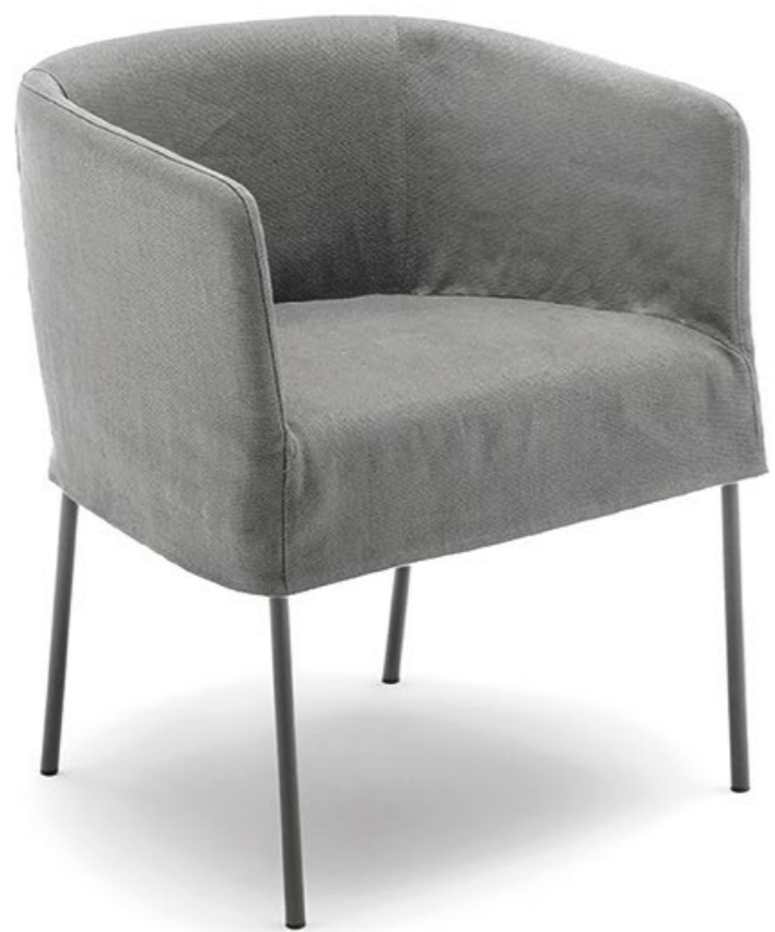
— Poltroncina Maja D con vestina corta