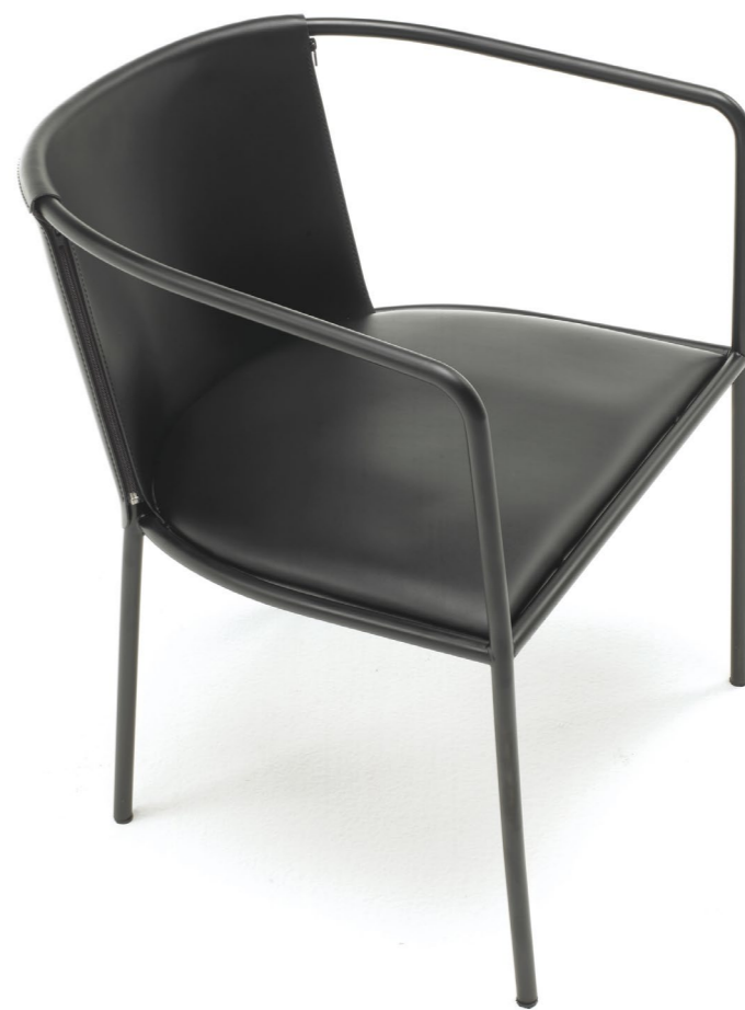
— Poltroncina Maja D senza vestina